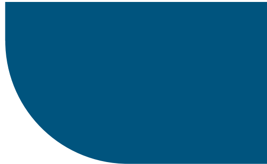
Das Pkw-Label: mehr Transparenz für Ihre Kaufentscheidung.

Kraftstoffkosten und Kfz-Steuer pro Jahr